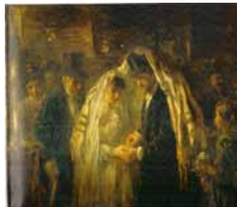
Joodse bruiloft; Jozef Israëls

Een diepgaande cursus waarin u met uw vragen terecht kunt.