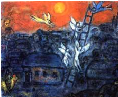
Jacob's ladder; Chagall

Ben je op zoek naar je werkelijke potentieel? Ben je toe aan een methode van persoonlijke groei en wil je hier tijd en energie in steken? Aan de hand van klassieke Joodse teksten, aanvullend persoonlijk materiaal en eigen ervaringen wordt in deze cursus van 5 lessen op praktische en intensieve wijze kennisgemaakt met Moessar.