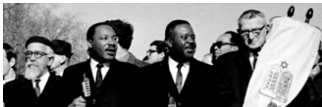
Heschel (I) naast M.L. King

Door middel van close reading verkennen we de verborgen waarheid en werkelijkheid die door de rabbijnen van de Talmoed, van de Zohar, van Safed en in verscheidene mystieke en Chassidische bronnen wordt gepresenteerd. U zult niet alleen kennis maken met de mystieke denkwereld met Heschel als gids, maar ook zelf worden gestimuleerd in de ontwikkeling van uw eigen spirituele bewustzijnsniveau! Gemiddelde kennis van Engels is gewenst.