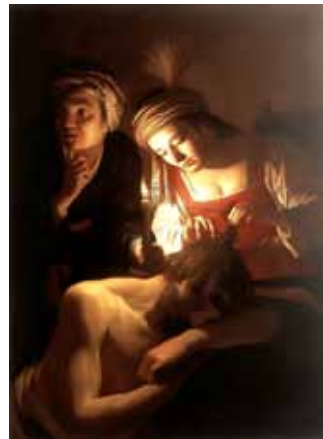
Sjimsjon & Delila; Gerrit van Honthorst

De docent is emeritus hoogleraar psychiatrie en staat borg voor een boeiende cursus.