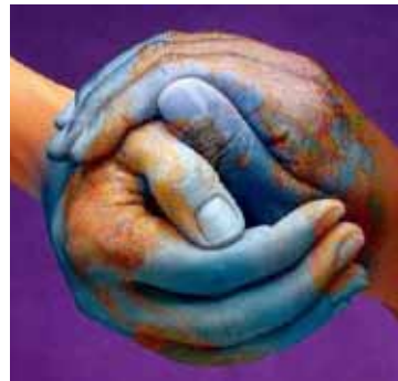
EC Communication Task Force

Elke bijeenkomst bestaat uit een deel "college" en een deel vaardigheidstraining.